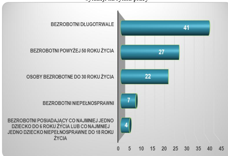
Wykres 4. Liczba osób, które ukończyły szkolenie – osoby będące w szczególnej sytuacji na rynku pracy