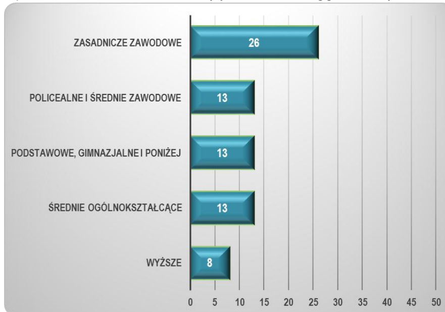
Wykres 3. Liczba osób, które ukończyły szkolenie według poziomu wykształcenia